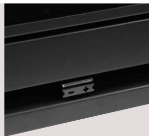
Commande de réglage d'air unique