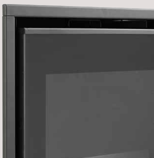
Porte plein verre avec cadre de finition de série